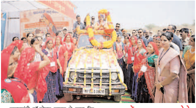
मुख्यमंत्री डॉ.मोहन यादव ने कहा कि ऐसा विशाल विवाह समारोह आनंदित कर रहा है, 2000 जोड़ों को परिणय सूत्र में बंधते हुए देखना एक नया अनुभव है। यह उन 4000 परिवारों के लिए एक सुखद अवसर है एवं इस विशाल समारोह में मंत्रोच्चार से धरती गुंजायमान हो चुक है। उन्होंने बताया कि आपका सभी वरों से कहा कि अपनी बेटियों का कन्यादान किया है इनका जीवन खुशियों से भरा रहे यही मंगल कामना है। उन्होंने कहा भगवान सूर्य को साक्षी मानकर आज 2000 जोड़ों परिणय सूत्र में बंधे हैं। मनुष्य जीवन के 16 संस्कारों में से पाणिहोम संस्कार मुख्य गृहस्थ सूत्र में प्रवेश के लिए महत्वपूर्ण संस्कार है, इसमें माध्यम से 7 फेरों के माध्यम से 7 वचनों को पुरा कर सतत जन्मों तक बंधन थापित होता है। ईश्वर से मंगल कामना है कि आपके जीवन में सदैव खुशियां रहे।

झाबुआ। आज जिले में 27 मार्च को मुख्यमंत्री डॉ.मोहन यादव के आतिथ्य में मुख्यमंत्री कन्या विवाह,निकाह योजनातर्गत विशाल सामूहिक विवाह समारोह आयोजित किया गया जिसमें मुख्यमंत्री लगभग 2000 जोड़ों को सुखद वैवाहिक जीवन के लिए आशीर्वाद देकर विशाल सामूहिक विवाह के साक्षी बने।