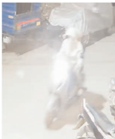
अलमारी का भी ताला टूटा हुआ था। अन्व जाकर देखा तो घर में रखी