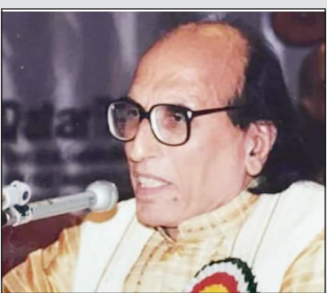
डॉ. बशीर बद्र केवल एक शायर का नाम नहीं है, बल्कि उस अहसास का नाम है जो इंसान को भीड़ में भी खुद से मिला देता है। 15 फरवरी 1935 को अयोध्या में जन्मे बशीर बद्र ने अपनी पूरी जिंदगी शायरी की सादगी और उसकी गहराई को समर्पित कर दी। अलीगढ़ मुस्लिम विश्वविद्यालय से शिक्षा ग्रहण करने के बाद, उन्होंने मेरठ कॉलेज के उर्दू विभाग में अपनी बौद्धिक उपस्थिति दर्ज कराई। उन्होंने साहित्य के फलसफ़े को किताबों से निकालकर मुशायरों के मंचों और आम आदमी के ड्राइंग रूम तक पहुँचाने का जो काम किया, उसकी मिसाल मिलना मुश्किल है।

वे केवल शायर नहीं, बल्कि उर्दू और हिंदी को जोड़ने वाले एक सेतु थे। उन्होंने हमेशा माना कि भाषा का कोई मज़हब नहीं होता, वह केवल संवेदनाओं की वाहक होती है। उनके व्यक्तित्व का एक और पहलू यह था कि वे बहुत ही जमीन से जुड़े इंसान थे। तमाम उरलाबियों के बाद भी उन्होंने कभी अपनी सादगी नहीं खोई। वे अक्सर अपने घर की दरवाज़े पर बैक़दर घंटों तक अपनी यादों को समेटा करते थे। उनकी याददास्त के बना होने की खबरें जब आईं, तो उनके चाहने वालों का दिल दहल गया था। उन्हें वह दुख था कि अब वे अपनी ही पुरानी ग़लों को शायद ही याद कर पाएँ, लेकिन निश्चित का खेल देँधए, उनकी शायरी तो हर उस इंसान की जुबान पर थी जिसे ज़िंदगी में कभी न कभी मोहब्बत या युवुई का सामना करना पड़ा। वे एक ऐसे दरिया थे जो अपनी मौज में बहते हुए हर पुरुष चेहरे पर नमी और मुस्कान बिखेरते थे। उर्दू अरब और शायरी की दुनिया में डॉ. बशीर बद्र को एक नाम है, जिन्होंने शब्दों को केवल कमाज पर नहीं उतारे, बल्कि उन्हें इंसानी रूह की धड़कन बना दिया। 28 मई 2026 को उनका भोपाल में निधन हुआ साहित्य जगत के लिए एक युग का अन्तगमन। आज जब बशीर बद्र साहब हमारे बीच